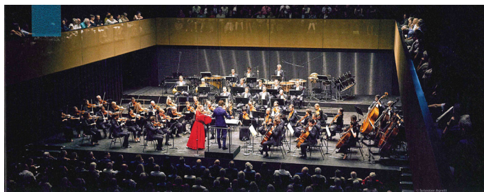
Der grosse Konzertsaal wurde am 26. August mit einem Eröffnungskonzert eingeweiht.