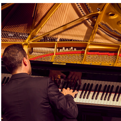
1 er Concert de saison