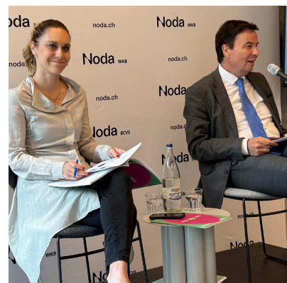
Lancement de la saison 2025-2026