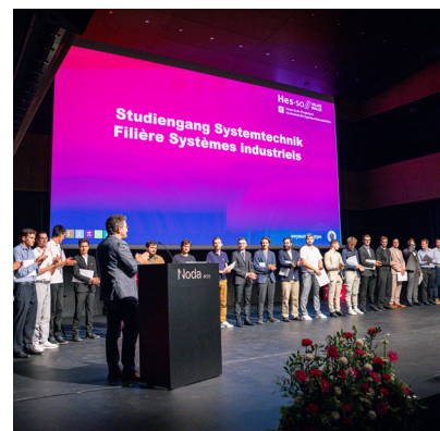
Remise de prix de la HES-SO Valais-Wallis