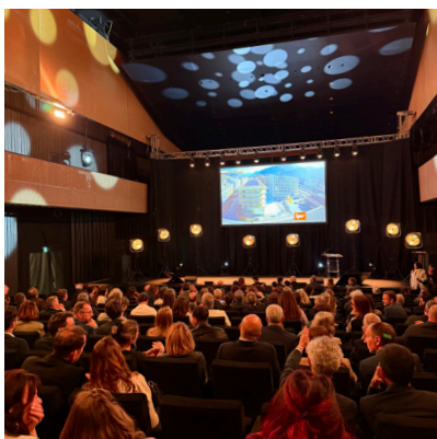
Inauguration du quartier Cour de Gare

20 décembre : Concert de Noël avec Sinfonia Valais-Wallis et Béatrice Berrut